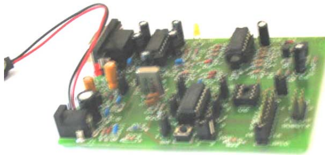
Figura 5. – Emulador en Tiempo Real “EVAL08QTY” p/ los HC908QT / QY / QB.