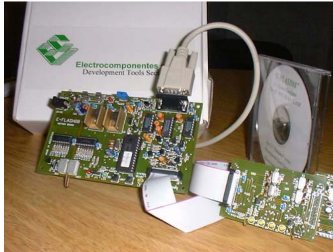
Figura 4. – Emulador en Tiempo Real “E-FLASH08” para todos los HC908.