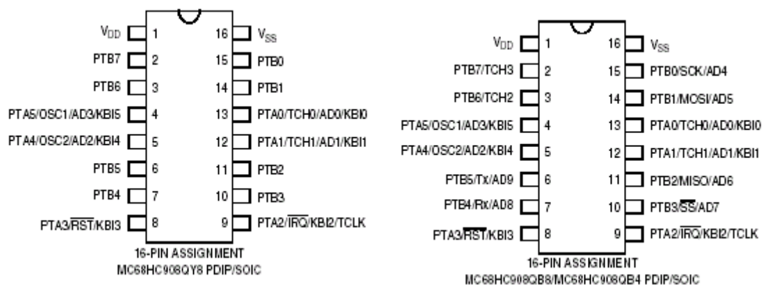
Figura 2. – Distribución de pines en la familia HC908QBx / QY8.

Como dato no menos importante, la familia “QBx” (HC908QB8 / HC908QB4 / HC908QY8) es pin a pin compatible con la familia “HC908QYx” o sea HC908QY1 / HC908QY2 / HC908QY4, lo que facilita la migración de uno a otro chip sin cambios en el hardware.